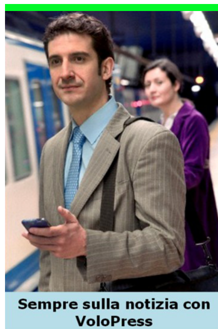
Sempre sulla notizia con VoloPress

Obiettivo di VoloPress Archivio è quello di estendere, per un insieme definito di fonti di interesse nazionale, il periodo di disponibilità delle notizie normalmente monitorate da VoloPress.